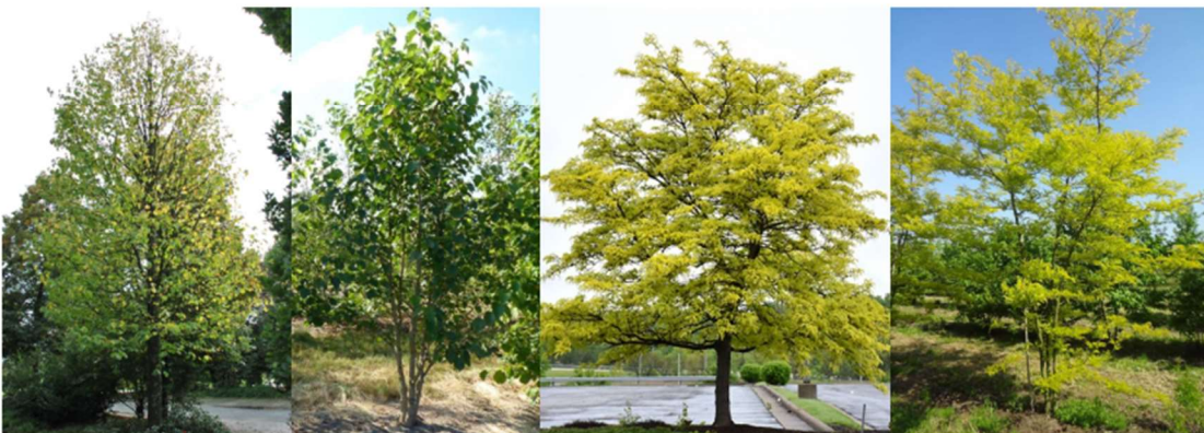
Corylus columa, Corylus columa multistem, Gleditsia triacanthos Sunburst, Gleditsia triacanthos Sunburst multistem