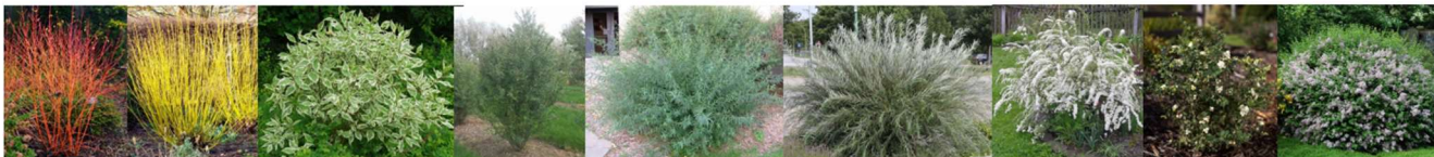
Cornus sanguinea Winter Beauty, Cornus stolonifera Flaviramea, Cornus alba Elegantissima, Ligustrum vulgare , Salix purpurea Gracilis, Salix rosmarinifolia , Spiraea salicifolia , Symphoricarpos albus , Syringa meyeri Palibin