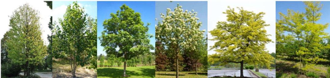
Corylus columa, Corylus columa multistem, Fraxinus excelsior, Fraxinus ornus Mecsek, Gleditsia triacanthos Sunburst, Gleditsia triacanthos Sunburst multistem