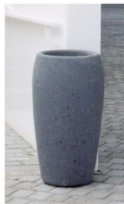
COȘURI DE GUNOI