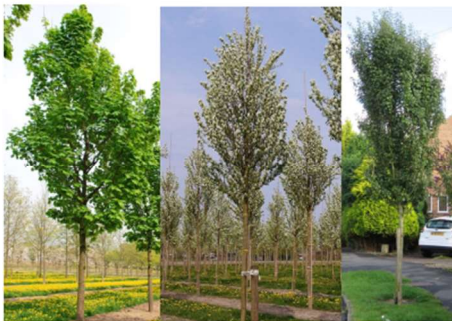
Acer platanoides Columnare, Amelanchier alnifolia Obelisk, Crataegus monogyna Stricta