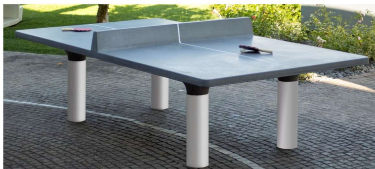
TENIS DE MASĂ