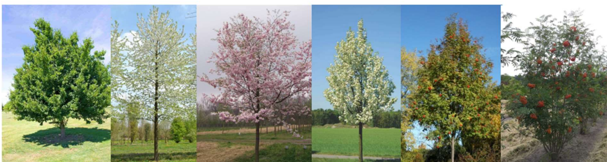
Acer tataricum, Prunus avium Plena, Prunus sargentii Accolade, Pyrus calleryana Chanticleer, Sorbus aucuparia, Sorbus aucuparia multistem