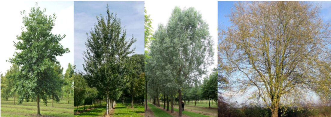
Alnus cordata, Populus tremula Tapiau, Salix alba, Salix caprea