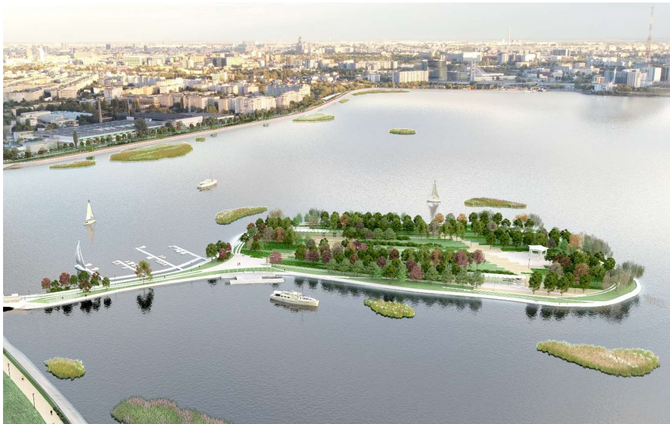
Figura 6 – Vedere aeriană cu parcul Insula Lacul Morii