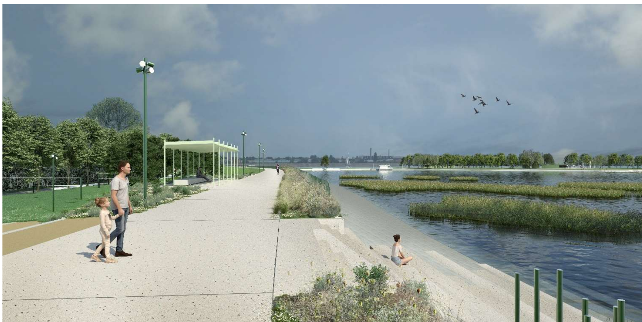
Figura 2 – Vedere de pe baraj în zona vestică a parcului, privind spre est și spre insulă