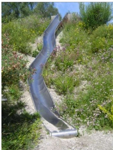
TOBOGAN PE PANTA DIGULUI