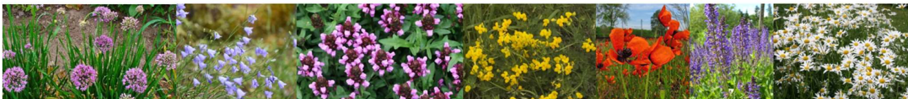
Plantago media , Geranium robertianum , Securigera varia , Allium lusitanicum , Campanula rotundifolia , Prunella grandiflora , Petrorhagia saxifraga , Dianthus carthusianorum , Dianthus deltoides , Dianthus superbus , Erodium cicutarium , Ranunculus bulbosus , Lotus corniculatus , Trifolium arvense , Achillea millefolium , Sanguisorba minor , Origanum vulgare , Linum austriacum , Silene vulgaris , Silene nutans , Linaria vulgaris , Thymus pulegioides , Papaver argemone , Papaver dubium , Calendula arvensis , Potentilla argentea , Potentilla verna , Hypochaeris radicata , Briza media , Festuca rubra , Festuca ovina , Festuca cinerea , Agrostis capillaris , Phleum phleoides , Poa compressa , Poa angustifolia