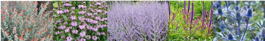
Sphaeralcea incana , Phlomis tuberosa , Phlomis russelliana , Perovskia atriplicifolia , Veronicastrum virginicum , Eryngium x zabeli Big Blue