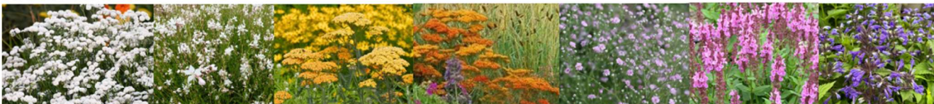
Achillea ptarmica Peter Cottontail, Gaura lindheimeri White Dove, Achillea millefolium Terracota, Achillea millefolium Anthea, Gypsophylla paniculata Festival Pink Lady, Salvia nemorosa Marvelrose, Salvia nemorosa Caradonna, Nepeta x fassenii Neptune