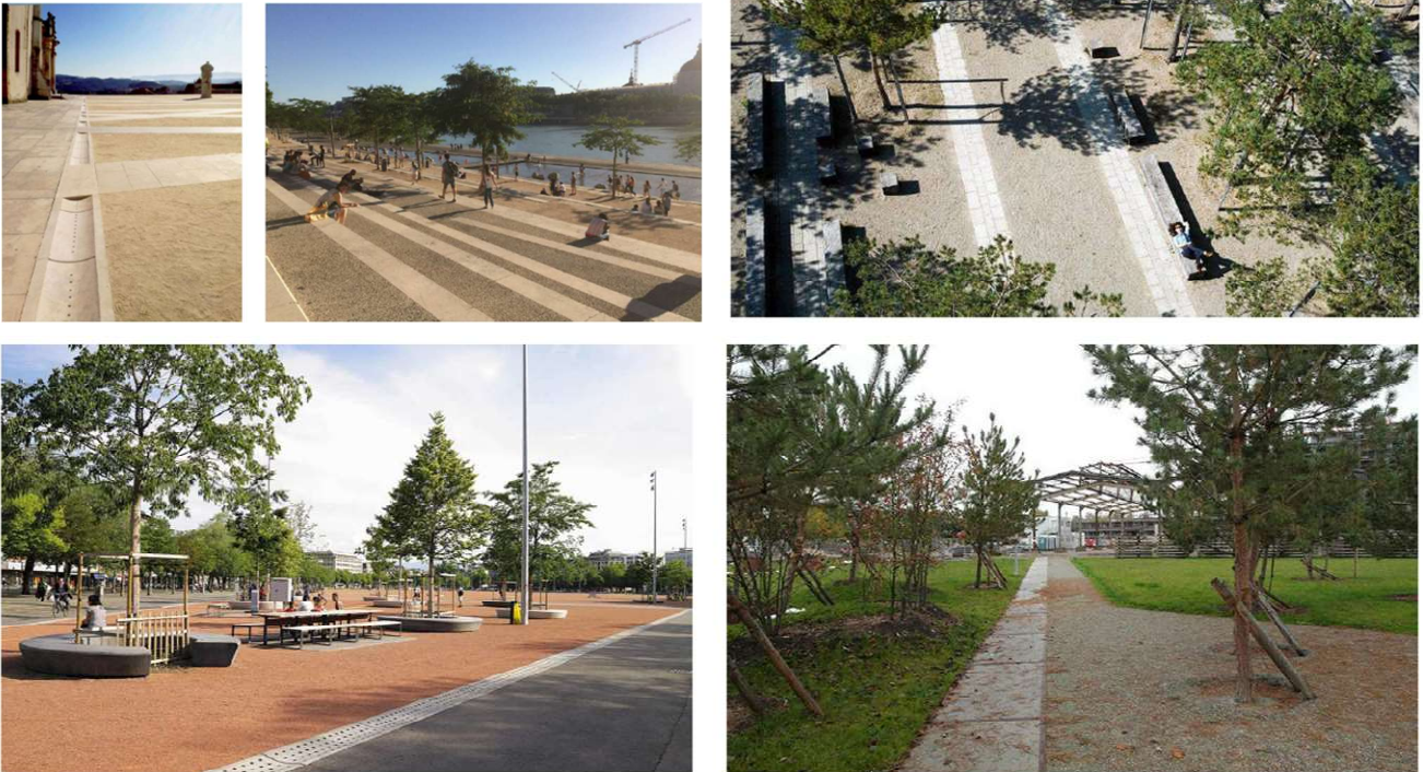
Figura 10 – Materialitate suprafețe