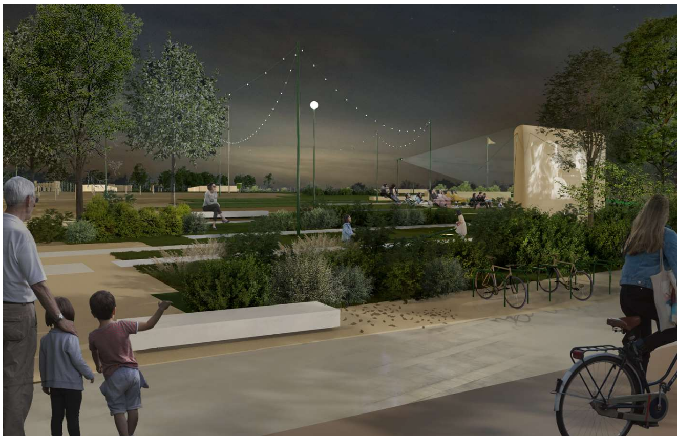
Figura 4 – Vedere din parcul liniar Lacul Morii privind spre accesul pe Insula Lacul MoriiF