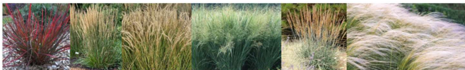
Andropogon gerardii Red October, Calamagrostis x acutiflora Karl Foerster, Panicum virgatum Heavy Metal, Sorghastrum nutans