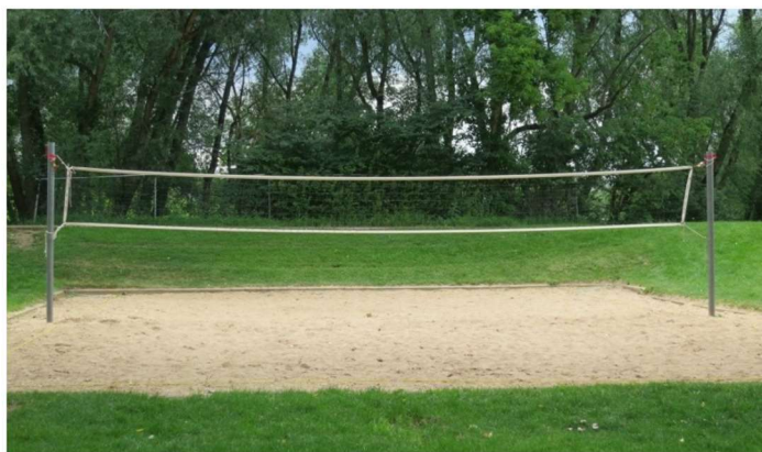
TERENURI DE VOLEI