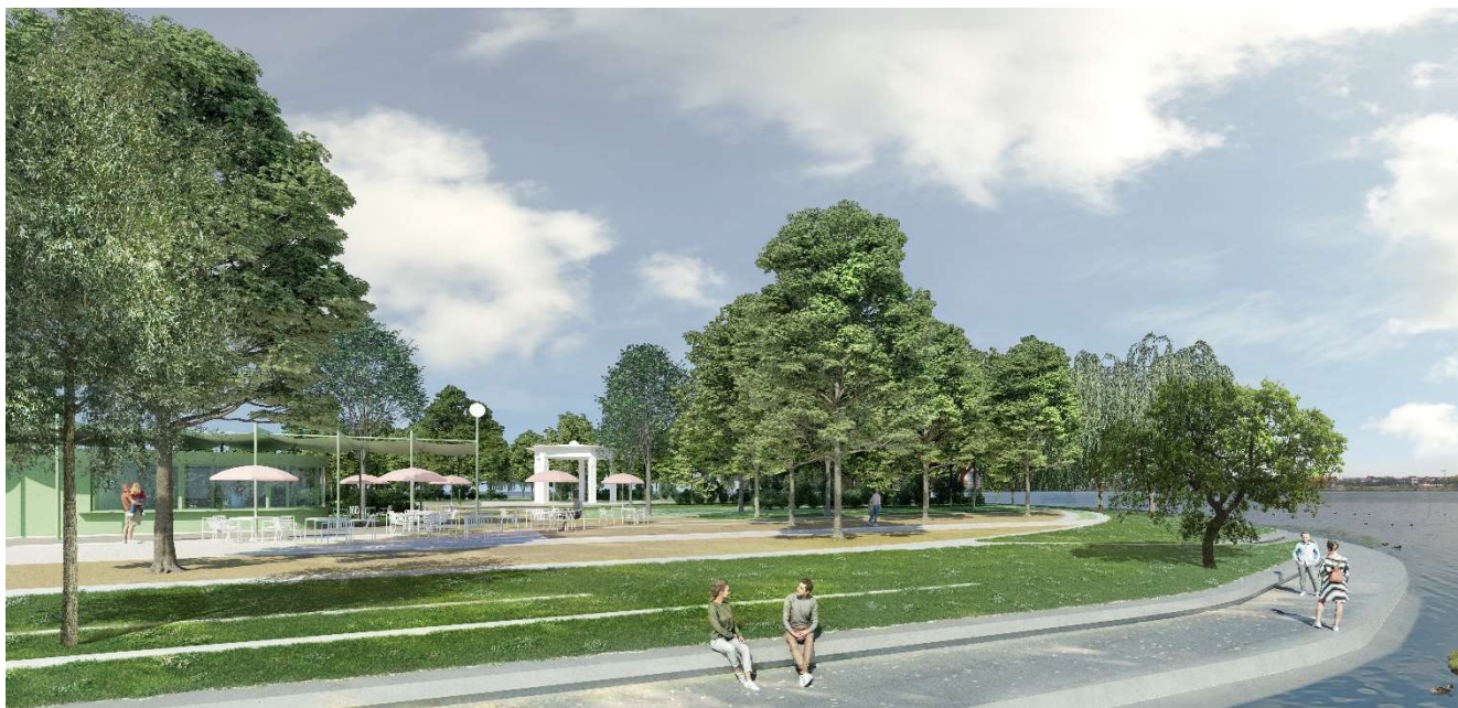
Figura 7 – Vedere dinspre vest cu Parcul Insula Lacul Morii