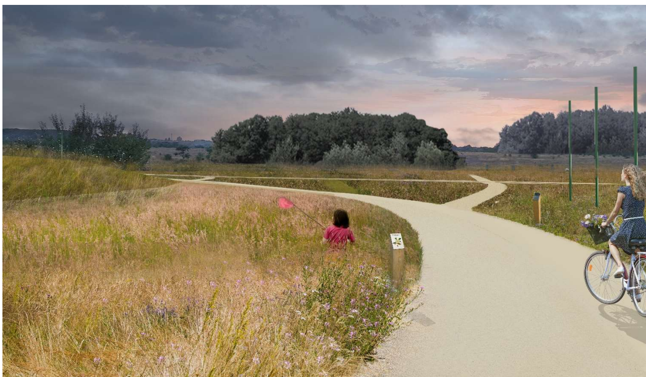
Figura 5 – Vedere din extremitatea vestică a parcului liniar Lacul Morii privind spre zona de polder din vest