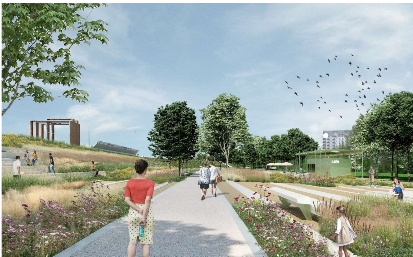
Figura 3 – Vedere din parcul liniar Lacul Morii privind spre nord