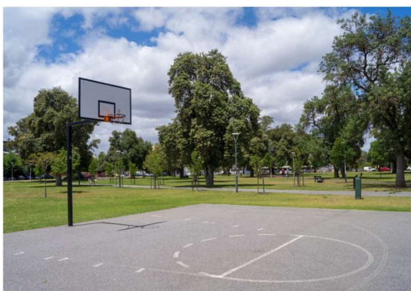
TERENURI DE BASCHET