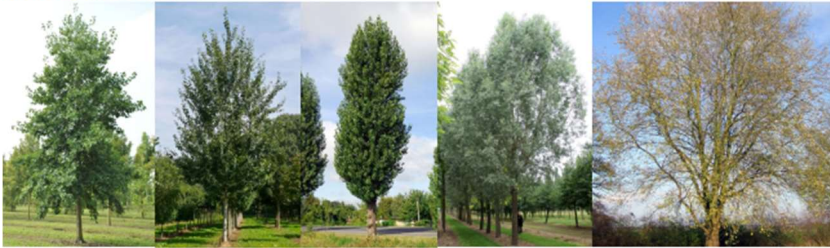
Alnus cordata, Populus tremula Tapiau, Populus nigra Italica, Salix alba, Salix caprea