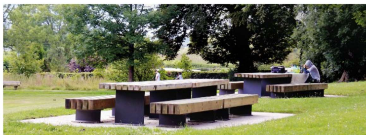
LOCURI PENTRU PICNIC