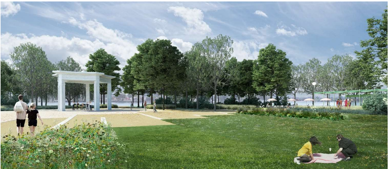
Figura 8 – Vedere din zona centrală a parcului Insula Lacul Morii