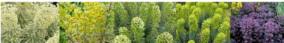
Euphorbia x characias Tasmanian Tiger, Euphorbia x characias Wulfenii, Euphorbia x polychroma , Euphorbia x characias Miner Merlot, Euphorbia x martinii Ascot Rainbow, Sedum spectabile Dark Magic, Sedum spectabile Peach Pearls, Sedum spectabile Double Martini