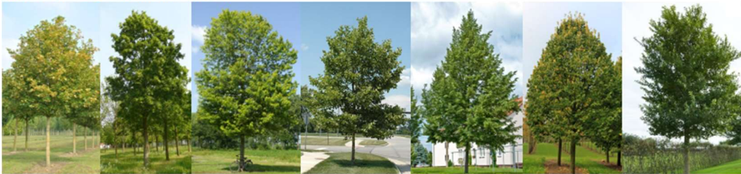
Acer campestre, Acer platanoides, Acer saccharinum, Platanus spp., Tilia cordata Rancho, Tilia tomentosa Brabant, Ulmus hybridus Rebona