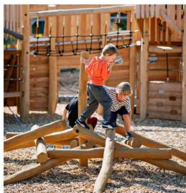
Figura 12 – Elemente de joacă