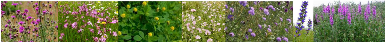
Sanguisorba minor , Origanum vulgare , Silene vulgaris , Medicago lupulina , Daucus carota , Saponaria officinalis , Crepis biennis , Anthyllis vulneraria , Galium album , Galium verum , Anthemis trictoria , Agrimonia eupatoria , Salvia pratensis , Rhinanthus minor , Malva sylvestris , Malva moschata , Knautia arvensis , Vicia cracca , Leucanthemum vulgare , Echium vulgare