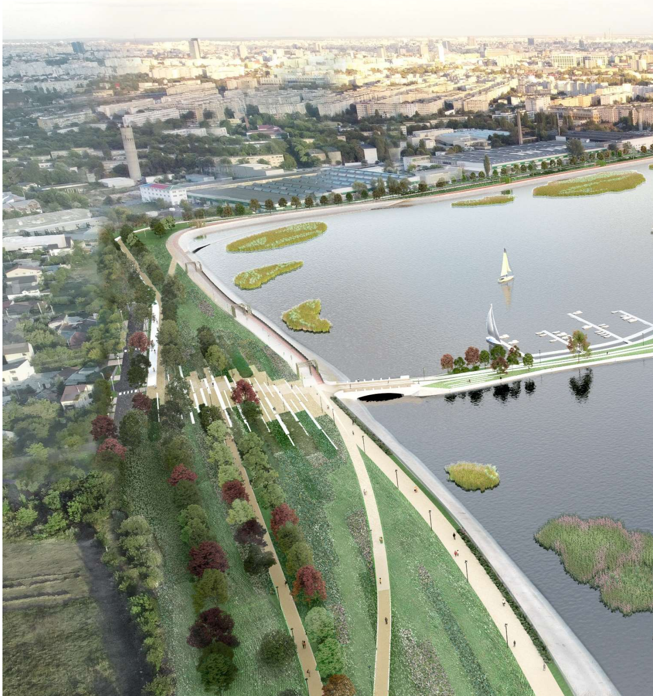
Figura 1 – Vedere aeriană cu propunerea de amenajare Parcul Liniar Lacul Morii