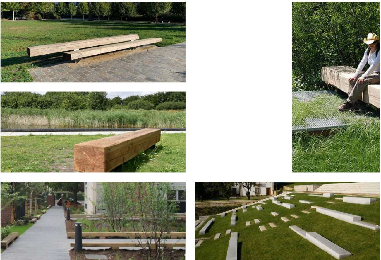
Figura 11 – Mobilier