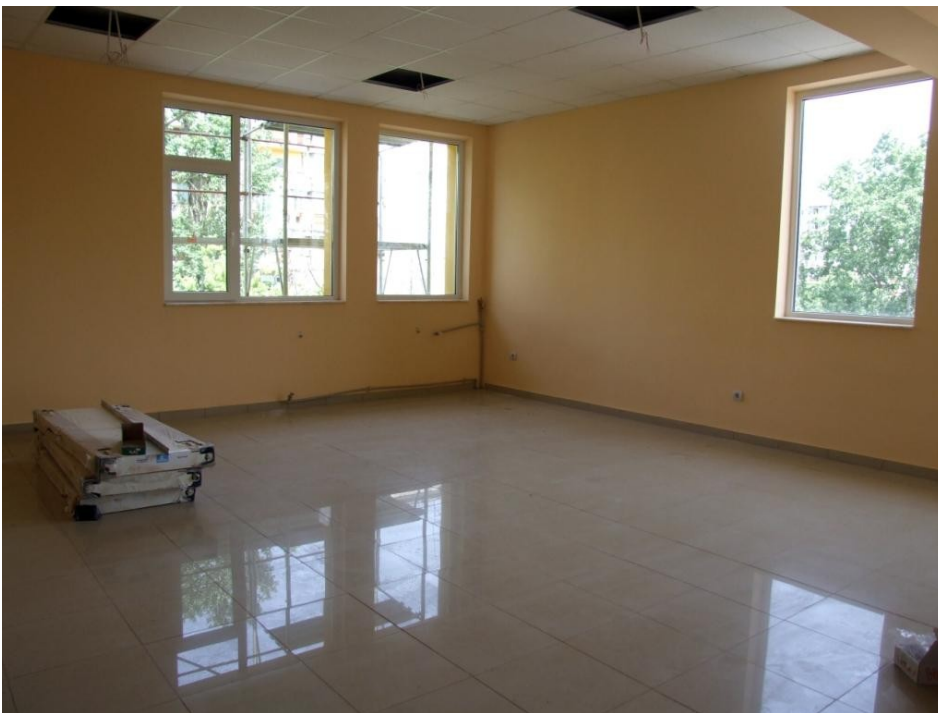
Sala în care va fi amenajat cabinetul oftalmologic

Complexul de Servicii Sociale „Sf. Nectarie” este unitate de asistență socială, fără personalitate juridică, în cadrul Direcției Generale de Asistență Socială și Protecția Copilului Sector 6 (D.G.A.S.P.C. Sector 6), înființat prin Hotărâre a Consiliului Local al Sectorului 6, București. Complexul de Servicii Sociale „Sf. Nectarie” funcționează în Municipiul București, la adresa din B-dul Uverturii, nr. 81, Sector 6.