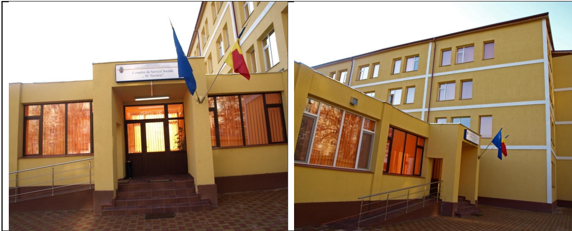
Complexul de Servicii Sociale „Sf. Nectarie” în care va fi amplasat cabinetul

Complexul de Servicii Sociale „Sf. Nectarie” este unitate de asistență socială, fără personalitate juridică, în cadrul Direcției Generale de Asistență Socială și Protecția Copilului Sector 6 (D.G.A.S.P.C. Sector 6), înființat prin Hotărâre a Consiliului Local al Sectorului 6, București. Complexul de Servicii Sociale „Sf. Nectarie” funcționează în Municipiul București, la adresa din B-dul Uverturii, nr. 81, Sector 6.