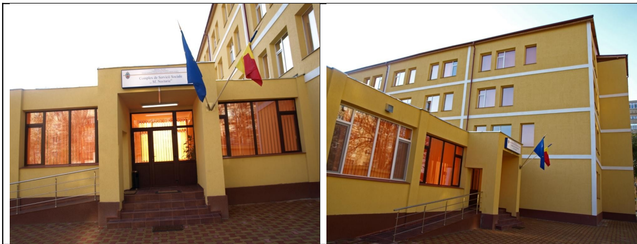
Complexul de Servicii Sociale “Sf. Nectarie” în care va fi amplasat cabinetul

C.S.S. “Sfântul Nectarie” are deja active anumite servicii sociale, medicale, spații de socializare, însă anumite spații permit dezvoltarea altor servicii, astfel încât acestea ar putea avea o destinație eficientă și practică pentru nevoile beneficiarilor. Prin acest proiect se propune amenajarea unui cabinet oftalmologic care va deservi persoanele vârstnice rezidente și persoanele aflate în dificultate din comunitate care necesită protecție socială. De asemenea, de servicii medicale vor beneficia și copiii aflați într-o formă de protecție socială sau cei din mediul familial care nu au posibilități în acest sens.