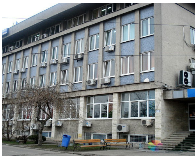
▪ Primaria Sector 6

In imaginile de mai jos sunt prezentate cateva cladiri pentru care primaria plateste factura de energie electrica.